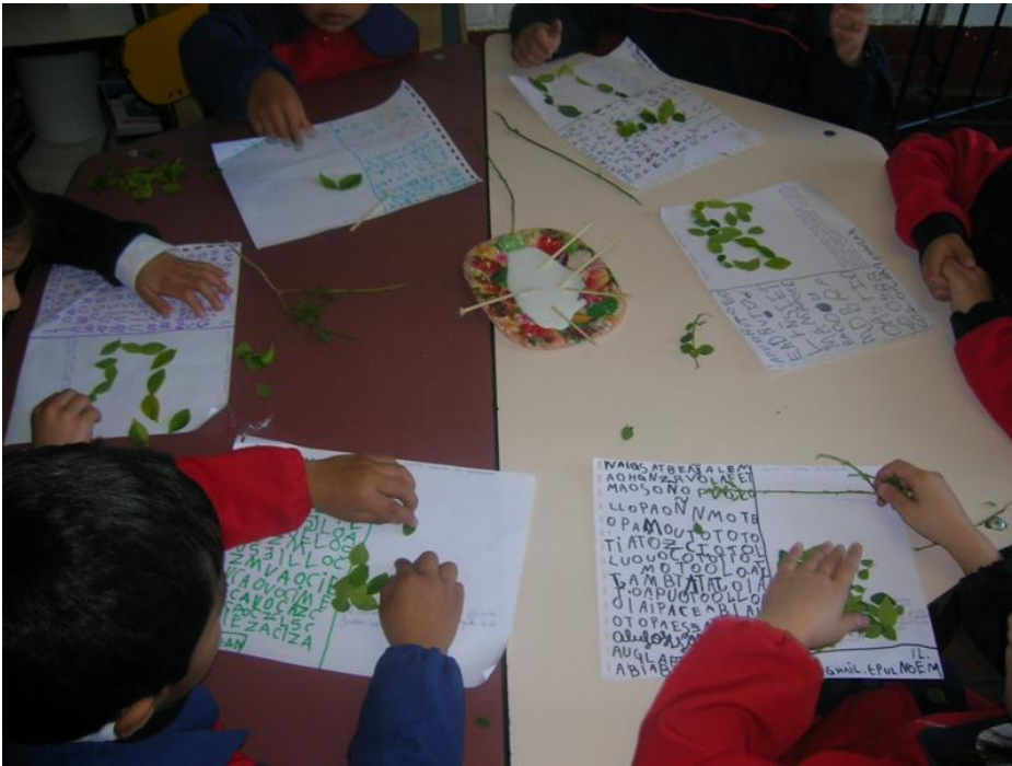
Tercero hierbas medicinales

Los niños investigan y exponen sobre: comidas típicas