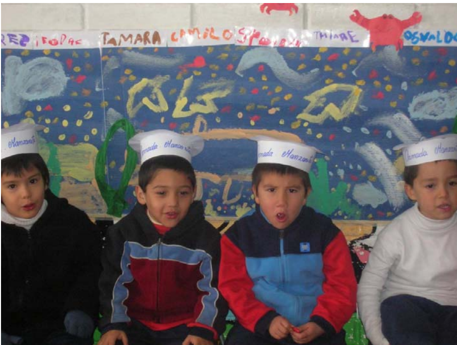
Riquezas del mar de Chile

Los niños investigan y exponen sobre: comidas típicas